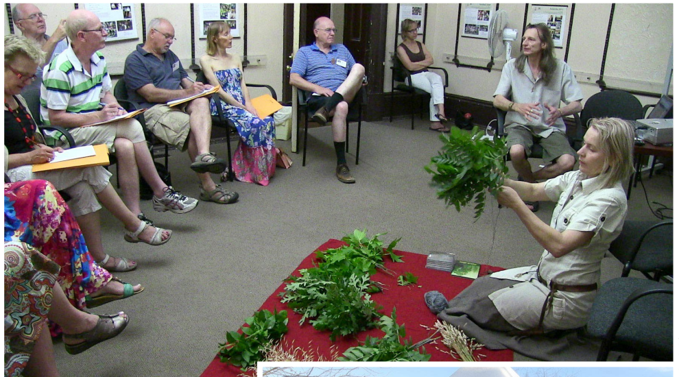
Aina taisa pirts pēršanās slotiņas.