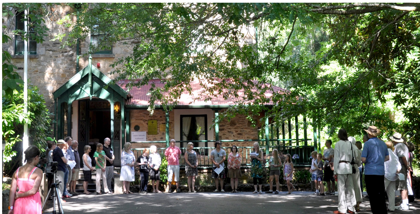
3x3 saietu atklāšana.