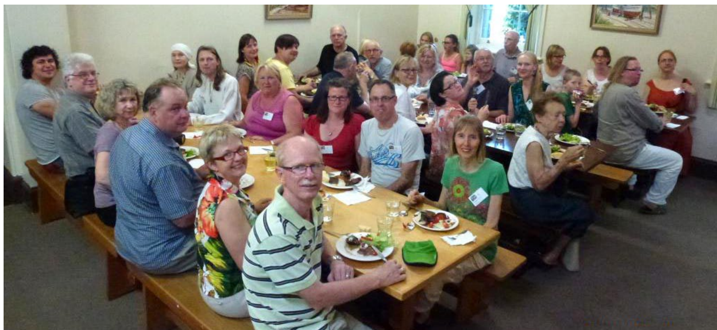
Vakariņas pirmajā vakarā.