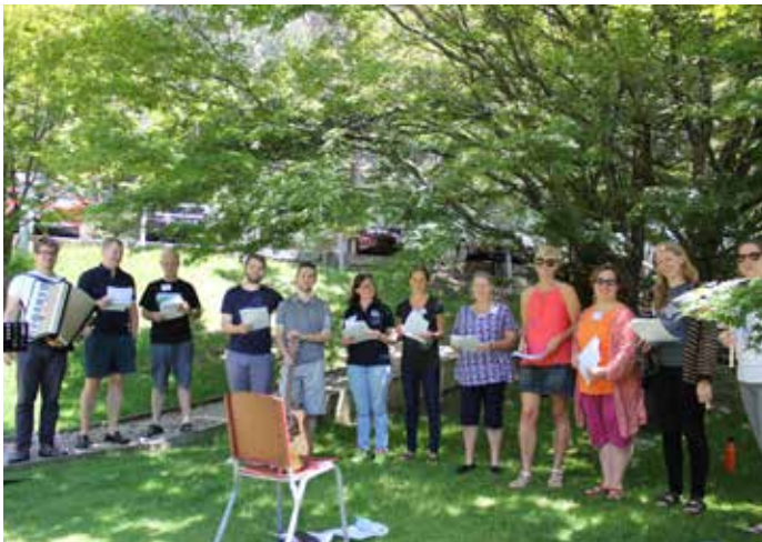
Kora mēģinājums tālu skan...

Ikvienam kopā roka jāpieliek, lai mūsu darbs uz priekšu iet!