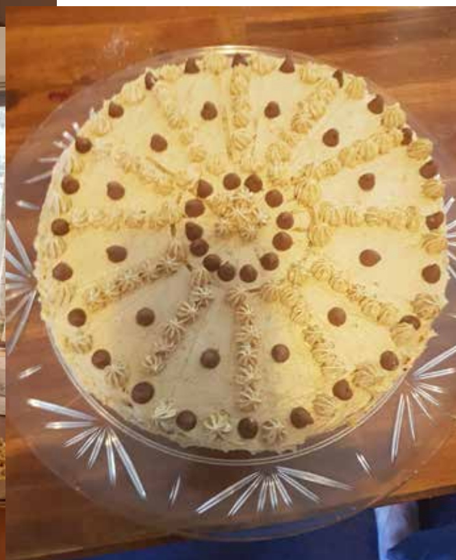
VIENA NO SVĒTKU KŪKĀM