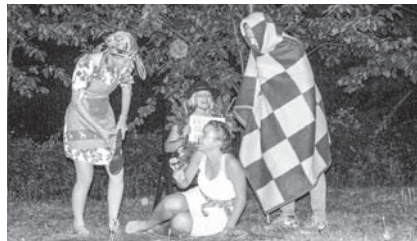
Latgāliešu tautasdziesmu Rūžeņa Daina, Anna, Mona un Jēkabs pasniedza pilnīgi jaunā versijā!