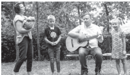
Krūmiņu ģimene visus aizkustināja ar sirsniņo tu vēl esi maziņais, visiem, visiem labiņais .