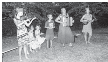
Ožehovsku ģimene ir daļa no Luxemburgas folkloras kopas Dzērves