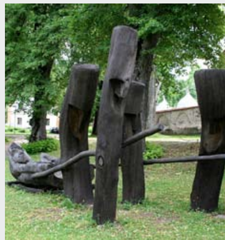
Skulptūra Ragavas , autori Andris Džiguns, Gundars Kozlovskis, Gatis Lucjanovs, Imants Spridzāns un Renārs Stempers. Skulptūra veidota Cesvainies 800 gadu svinību laikā 2009. gadā.