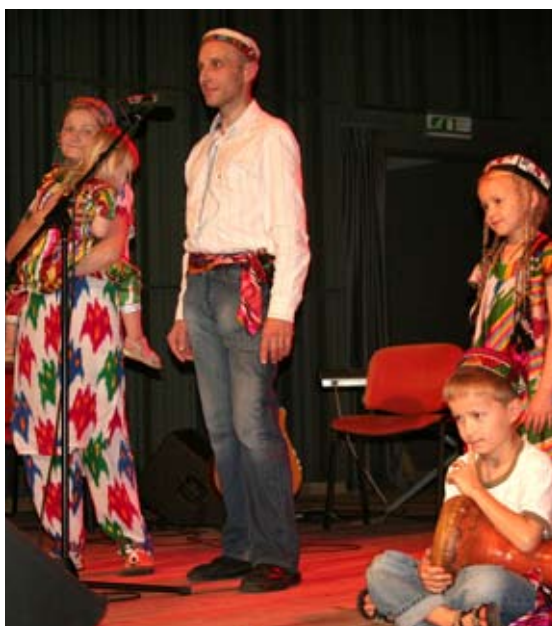
Štameru ģimene no Tadžikistānas dzied dziesmu, kuras nosaukums tulkojumā nozīmē Viens zieds