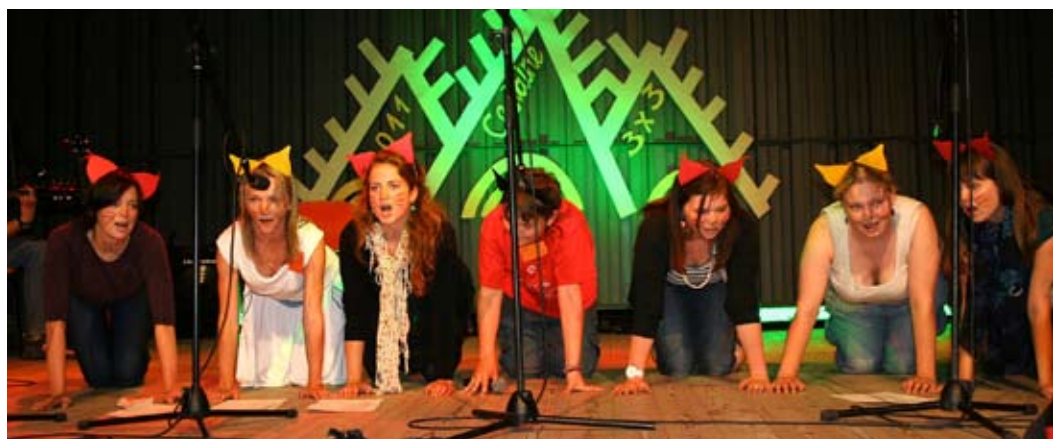
Grupa Runcis un sešas kaķes atraktīvi dzied Vīrietis labākos gados