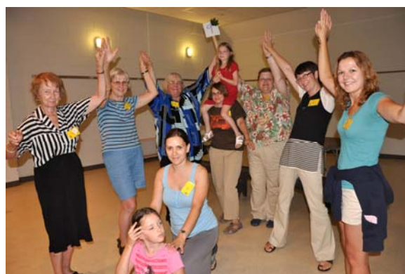
9. Kļavas (maple)