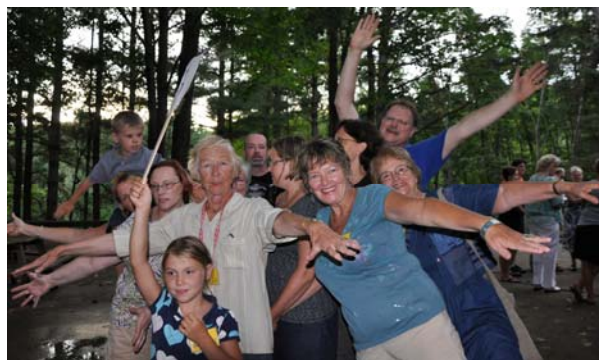
6. Egles (spruce)

Grupām paredzēts sēdēt kopā vairākās maltītēs un izgudrot ugunscura priekšnesumu, kam jāizmanāto savas grupas koka tēma.