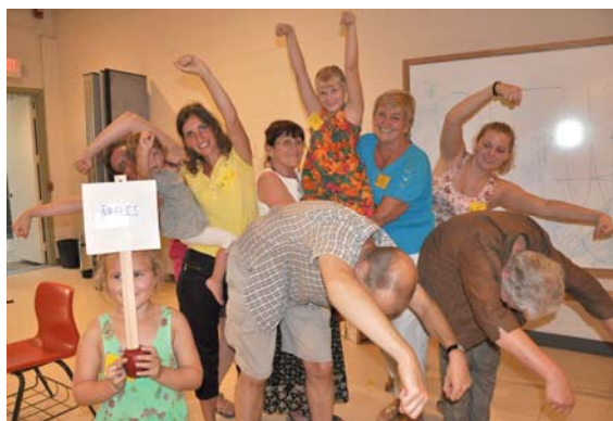
3. Ābeles (apple tree)