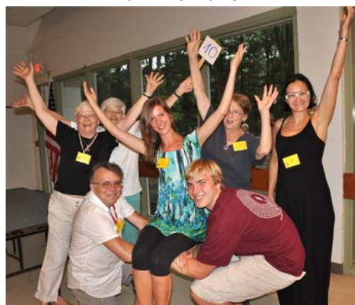
10. Oši (ash)