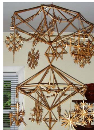
Gatavais puzuris no ALA Kultūras krātuves Priedainē