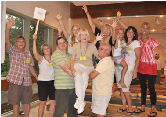
1. Ozoli (oak)

Jau pie reģistrācijas 3x3 dalībniekus sadalīja grupās. Iepazīšanās vakarā visi uzzināja savas grupas koka nosaukumu un grupai lika attēlot savu koku.