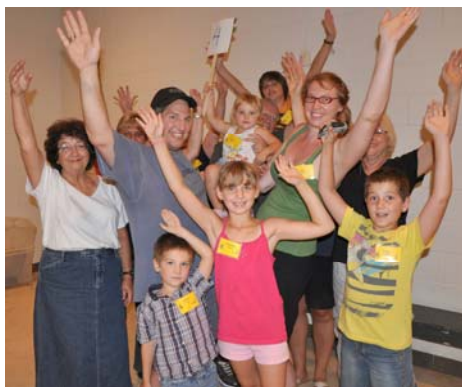
4. Ievas (European bird-cherry)