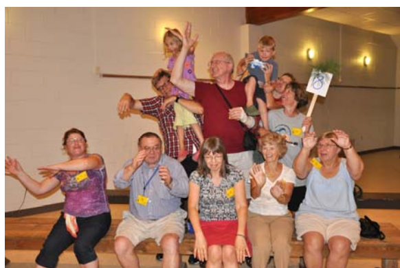
8. Priedes (pine)