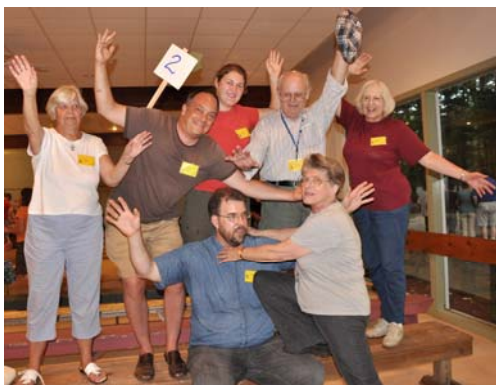
2. Liepas (linden)