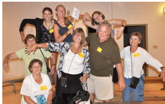
5. Bērzi (birch)