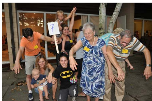
7. Vītoli (willow)