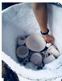
Ceplī ievieto mālu darbus dedzināšanai.