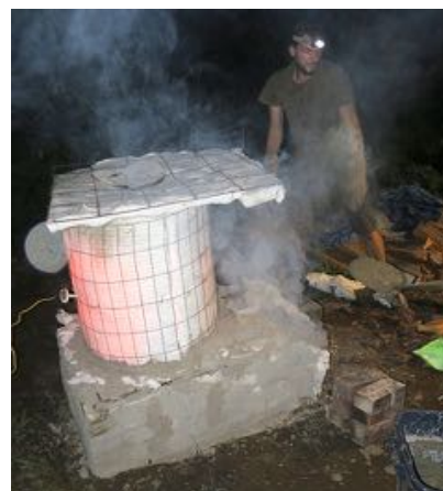
Cepli aizmūrē ciet un iet gulēt.