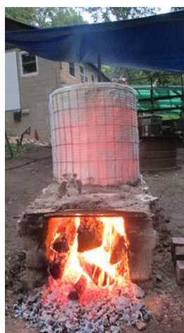
Ceplis tuvojas temperatūrai.