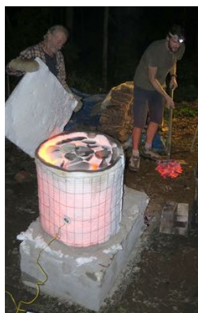
Olges izrok, lai ceplī piebāztu ar malku.