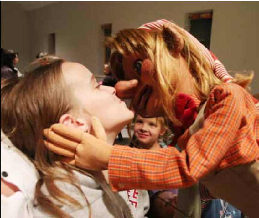
Vismīļākā atvadu buča. Bet nebēdā, mēs vēl noteikti tiksimies...