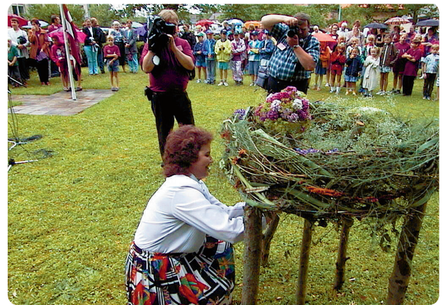
Pie simboliskās ligzdas nometnes atklāšanā katrs runātājs piestiprināja prievīti

Jaungulbenes pļavām. Izaugt vienā nedēļā un doties pasaulē pārvarēt grūtības, lidot un atgriezties – tāds ir kopā būšanas brīnums ligzdā Latvijā!