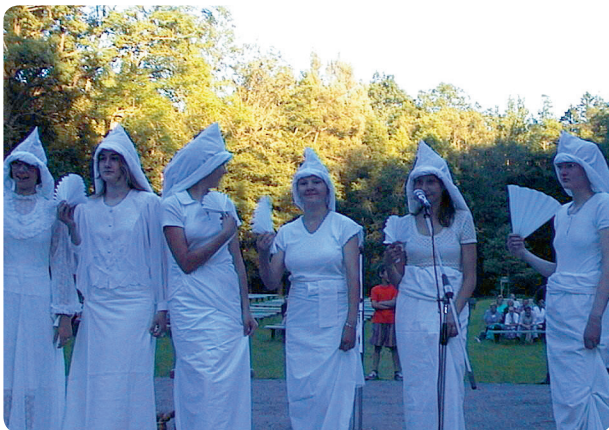
Gulbīši no Jaungulbenes