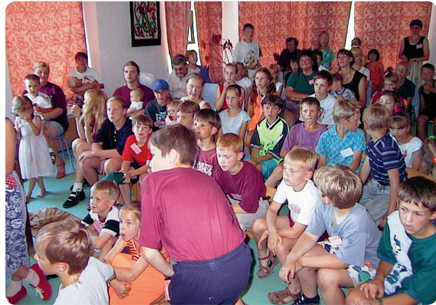
Animācijas filmas Lieli putni, mazi putni veidotāji un skatītāji