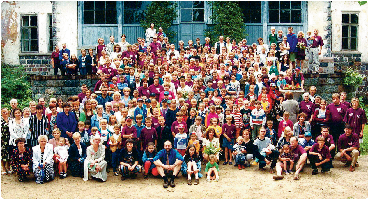
Jaungulbenes 3x3 kuplā saime