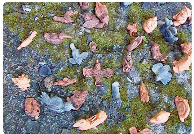
Izstādē – māla putniņi