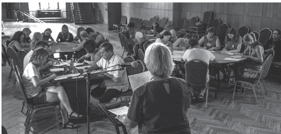
Eu, kur tas komats jāliek?