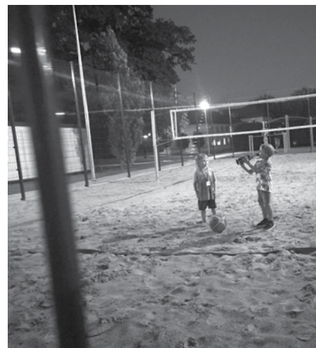
Jaunās paaudzes slepenais treniņš.

Nakts basketbola cīņa bija sīksta. Sacentās nometnieki un vietējie, uzvarēja vietējie. Bet, iespējams, ka tas bija tādēļ, ka mūsējie spēlēja bez kreklīm. Vai arī tādēļ, ka tas būs labs iemesls 3x3 atgriezties Jaunpili vēlreiz, lai revanšētos. ▲