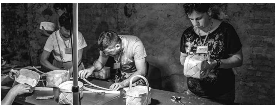
Katram savu groziņu!