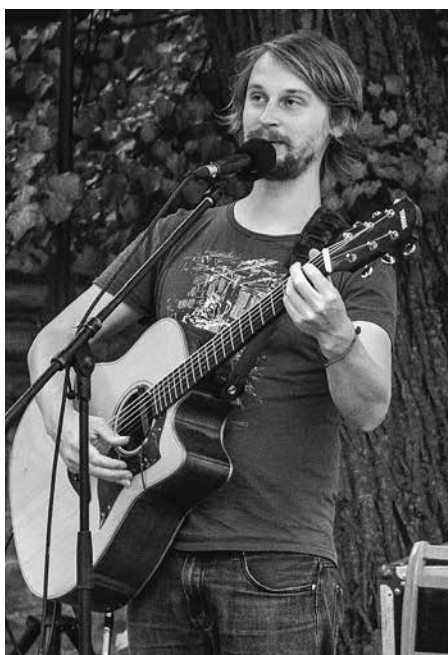
Puisis ar ģitāru.