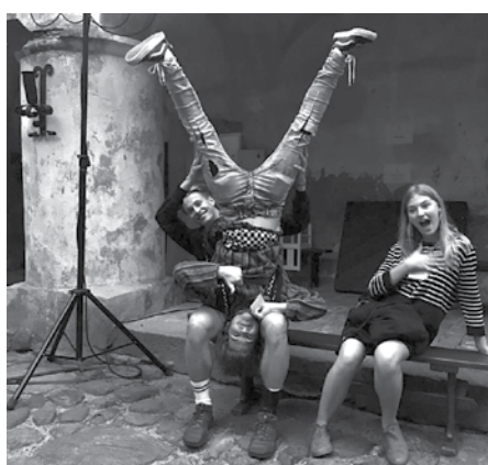
Kur augša, kur apakša?