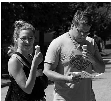
Saldējums – joprojām garšīgs!