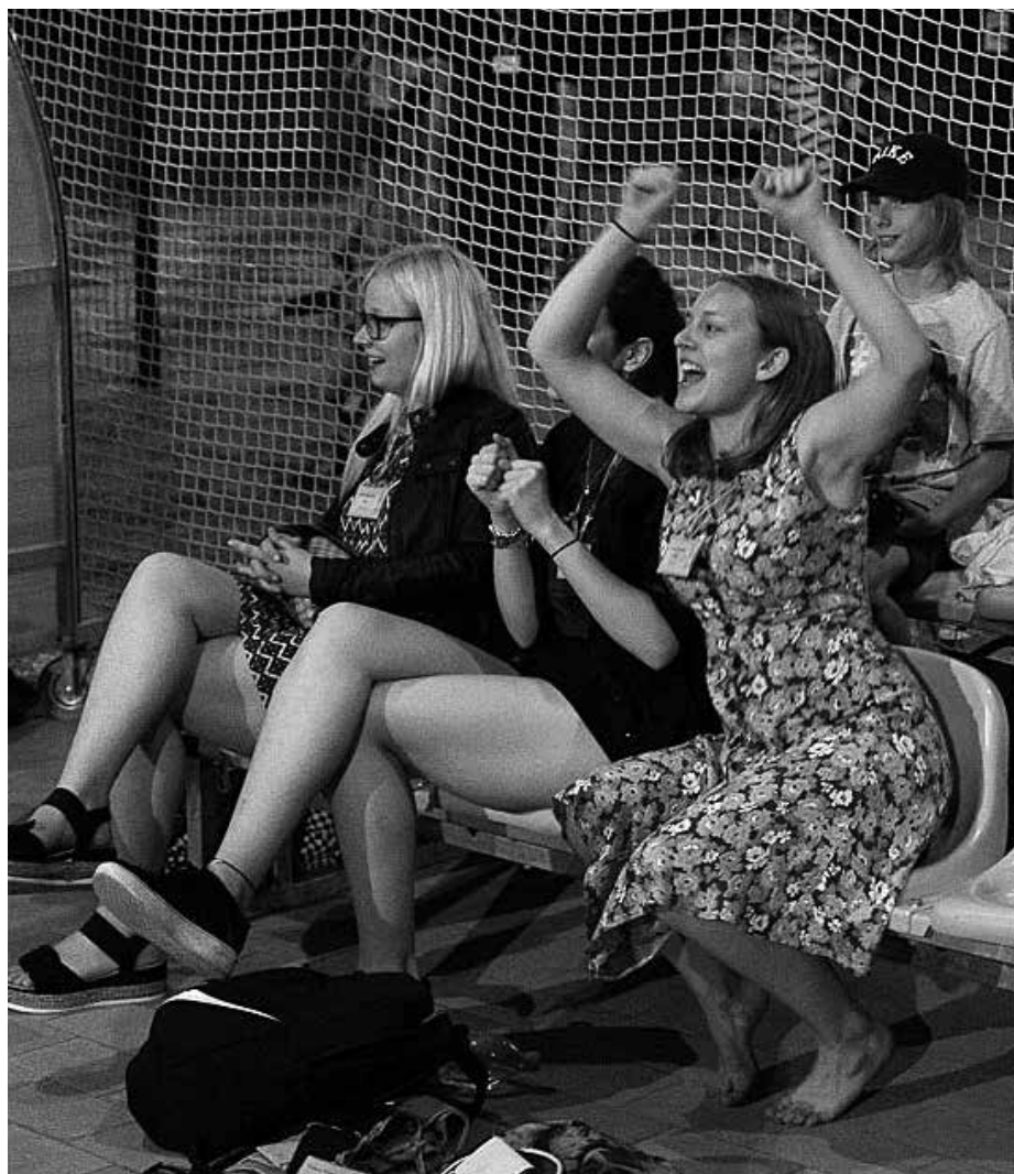
Darba grupas karsējmeitenes – vislabākās!