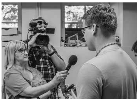
Izskatās, ka kādu rādīs „Panorāmā”...