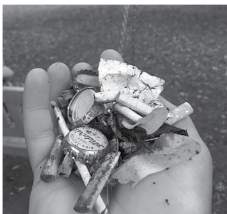
Dārgumi. Jāpiedāvā Vides rakstiem.