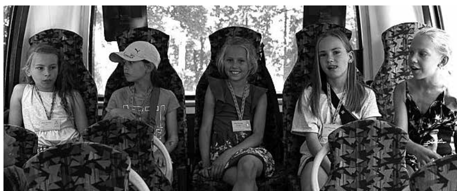
Labākās vietas autobusā jeb pēdējo rindu mafija.