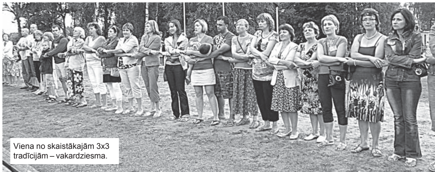
Viena no skaistākajām 3x3 tradīcijām – vakardziesma.

Atsauca Tupešu Māra: – Iedosim viņām uzēst vēl kādas pāris bulciņas, un būs mīkstāka sēdēšana.