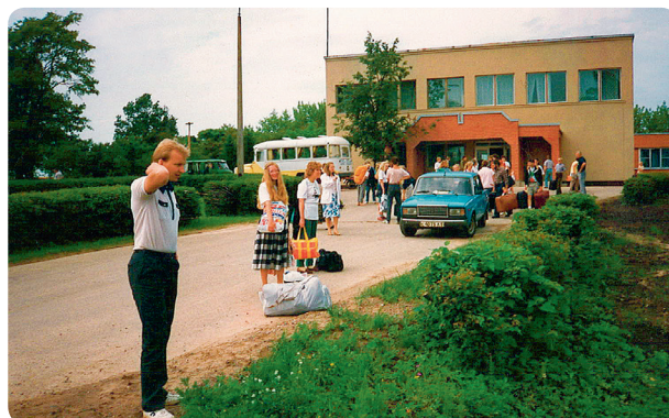
Pienākusi nometnes pēdējā diena, jākravā somas un jāatvadās