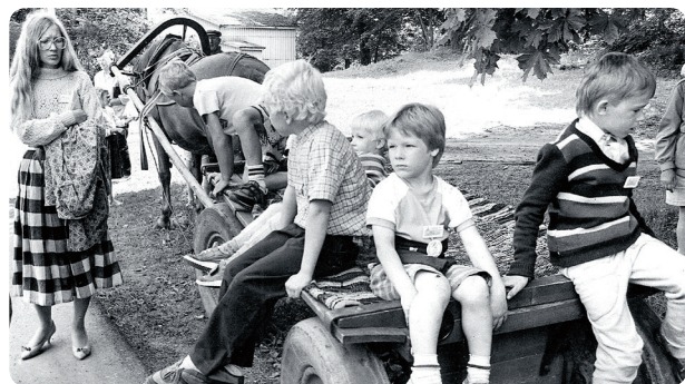
Pusreizpuses mazos dalībniekus uz viņu mājvietu bērnodārzā vizināja ar 27-gadīgo ķēvi Artu