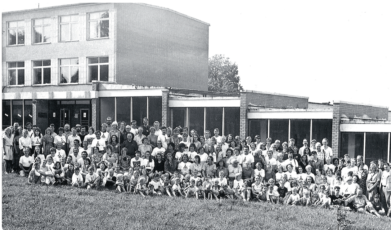
Madlienas 3x3 nometnes dalībnieki kopīgā fotogrāfijā