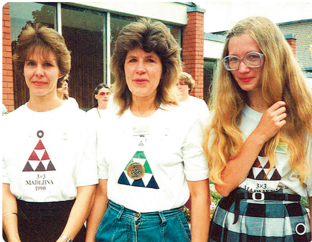
Madlienas 3x3 kreklīņi – nu jau kļuvuši par relikviju