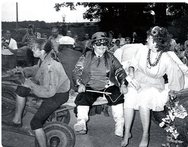
Notika arī masku balle ar čigānietēm, eņģeļiem un rūķiem