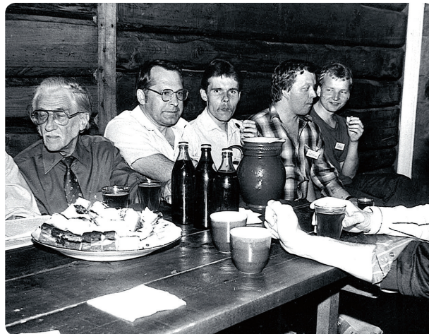
Nikšanas laikā pārrunātas gan nopietnas lietas, gan jokots, gan dziedāts