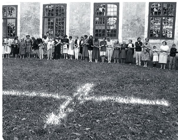
Pēc svecīšu dievkalpojuma Madlienas baznīcā visi dzied vakardziesmu