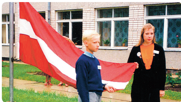
1990. gada 24. jūnijs plkst. 19.30. No ASV vestā un madlieniešiem dāvētā sarkanbaltsarkanā karoga iesvētīšana un uzvilkšana nometnes atklāšanā