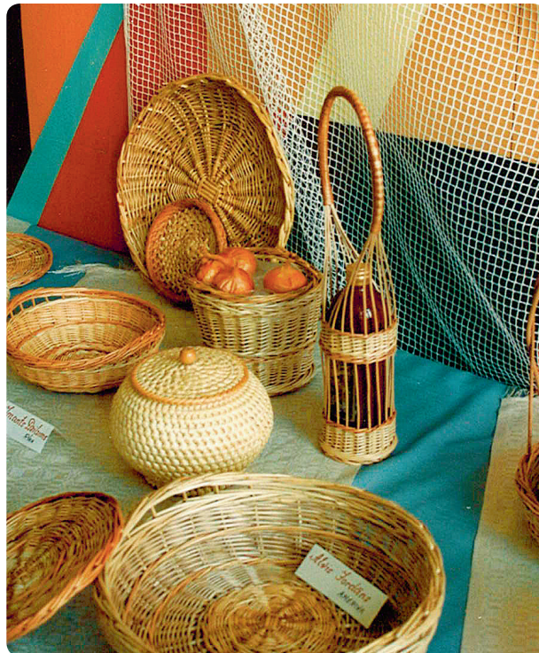
Mazs stūrītis no izstādes garajiem galdiem. Roku ieviržu dalībnieki vienā nedēļā bija veikuši brīnumdarbus

Augu dienu spindzēja joki un smieklī. Sevišķi spēcīgu intelektuālu augstsprieguma triecienu saņēmu Monreālas universitātes profesores Vairas Viķes-Freibergas folkloras nodarbībās. Ar tik izcilām gara dāvanām apveltītu un sugestīvo profesori vēl nebiju sastapis.