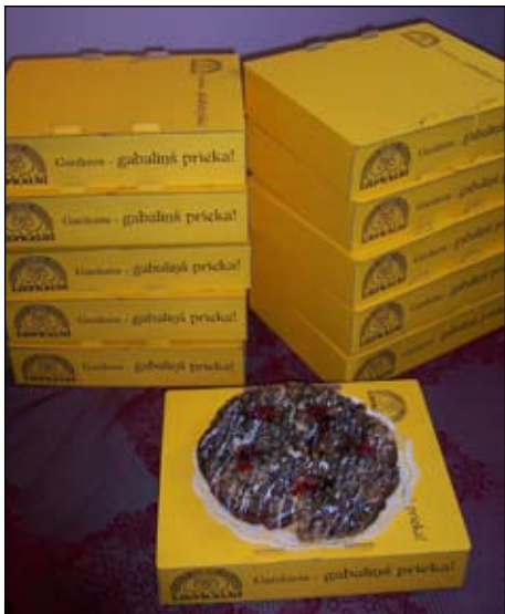
SIA "Liepkalni" mums ir sarūpējuši skaistu un spēcinošu ceļamaizi, atvadoties no Naukšēniem