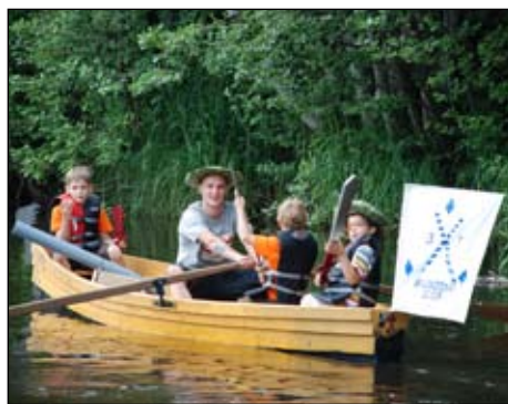
Nometnē tapušajai laivai ir arī savs karogs