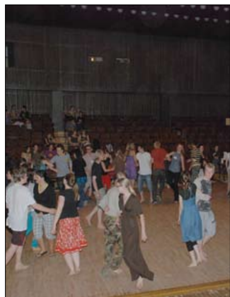
Un te - paši dancotāji!