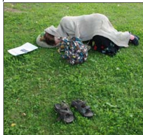
Pievakares atpūta ar "Robežnieku"