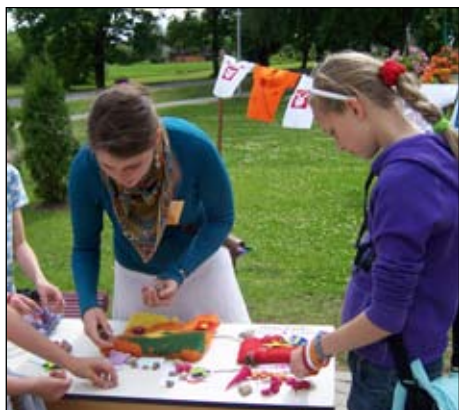
Ievirze Rokdarbi dažādās tehnikās iekārto izstādī