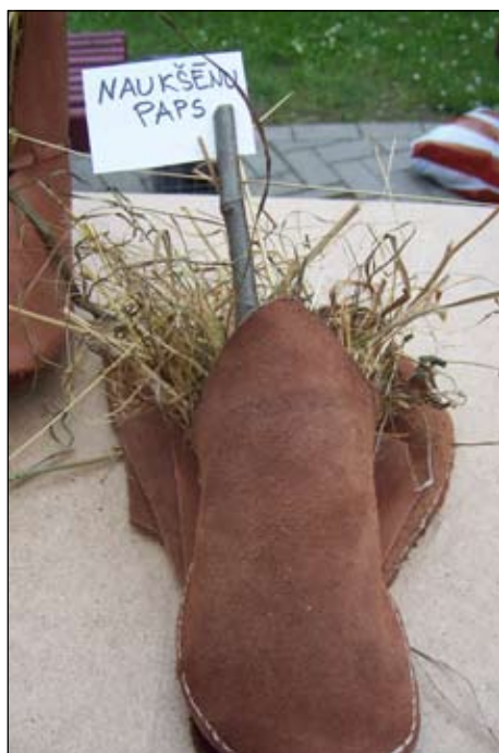
Naukšēnu paps nav tikai mītisks tēls - dzīvs pierādījums, ka viņš piedalījies visās nometnes aktivitātēs un paguvjis uzšūt puszābaku