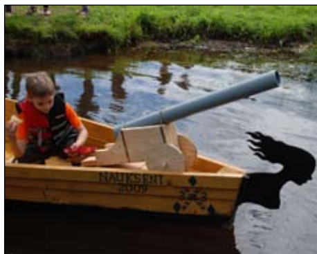
Rūjas pirāti dodas ceļā