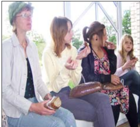
Tā garšo Liepkalnu maize pēc pusdienām