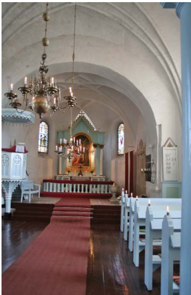
Neretas luterāņu baznīcā.

Dace Kronīte, Neretas Jāņa Jaunsudrabiņa vidusskolas skolotāja