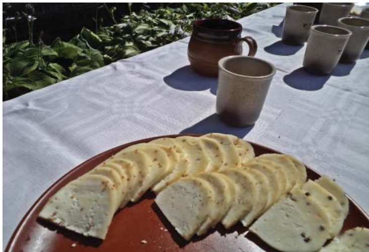
Aijas Leites sieri ar sešām dažādām piedevām.