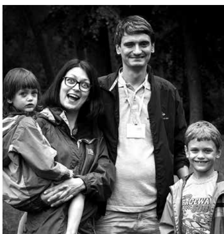
Mīlīgā Kažoku ģimene.