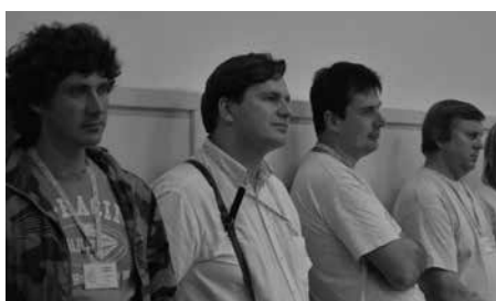
Lūk, vīri kā ozoli!