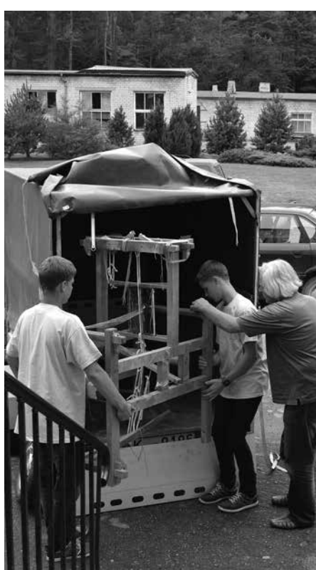
Ieradusies svarīga saieta dalībiece: stelles.