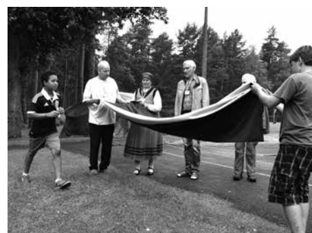
Saieta karogs – liels un daiļš kā Latvija.