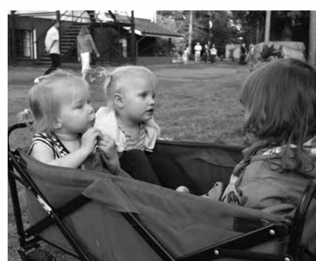
Trīs vīri laivā? Nē! Trīs dāmas karietē!