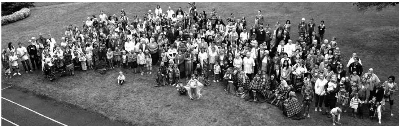
Tradicionālais saieta atklāšanas foto – skats no augšas. Tā, lūk, mūs redz saulīte.