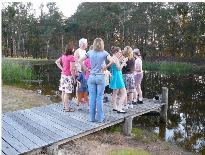
Šķēršļu gājiena šķērslis

Citus likumus, pēc kuriem jāizvēlas vai spēlēt kā lielajam, ar kādām kārtīm iet un ko atmet varat mēģināt uzzināt no kādām kāršu spēļu rokasgrāmatām vai uzvaicāt kādam, kas šo spēli pieprot. Principā nav tādu striktu noteikumu, vienkārši ir paņēmieni kopumi, kas parasti (uzsveru - parasti) palīdz uzvarēt. Taču ne vienmēr "pareizākais" gājiens būs arī izdevīgākais katrā konkrētā situācijā.