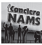
T/C Kanclera NAMS