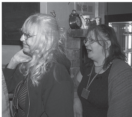
Lūdzu, dodiet katram tikai vienu, lai man arī pietiek!