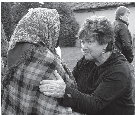
– Spēlēsīm spēli – Pazīsti mani!