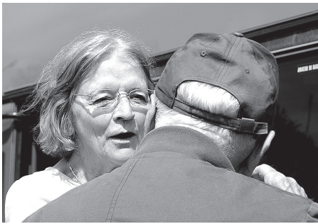
– Es taču Tev teicu, ka Alsunga ir Kurzemē!