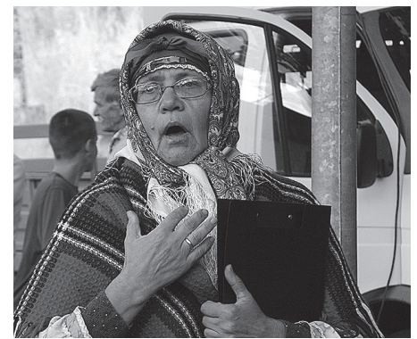
– Vai te man bija jādzied Ō vai Ē?!?!