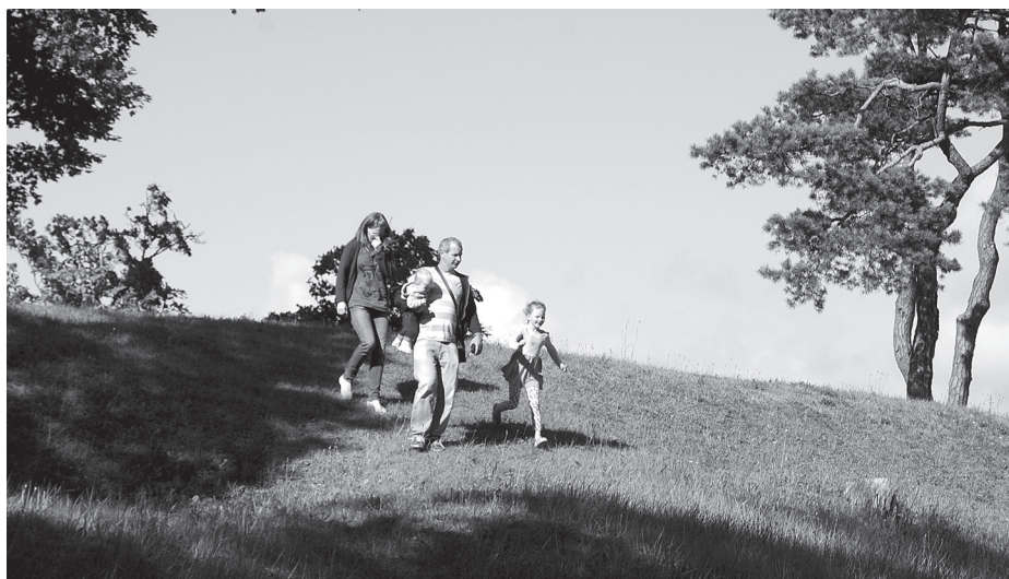
Skaista mana tēvu zeme par visām zemītēm...

Alsungas estrādē tapa gana liela sakta no margrietīnām, vēl dažiem pļavu