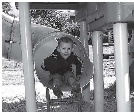
Un tā apkārtmēru mēra bērni...