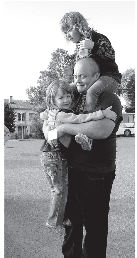
Meklējot izturības robežu.