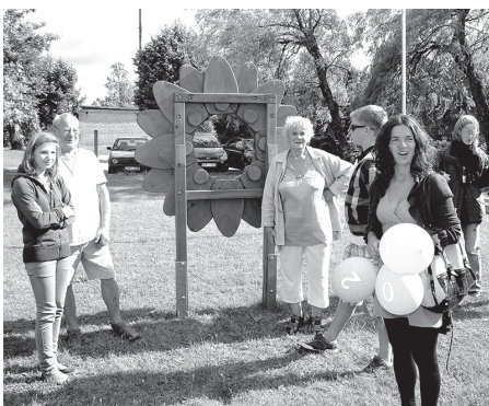
Ķermeņa apkārtmēra mērīšana pirms un pēc pusdienām.