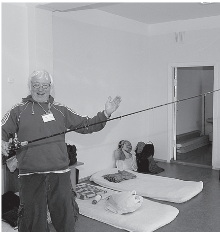
Līdz nometnes beigām izvilksū zivi, kas nav īsāka par vienu metru! Piepilda visas vēlēšanās.