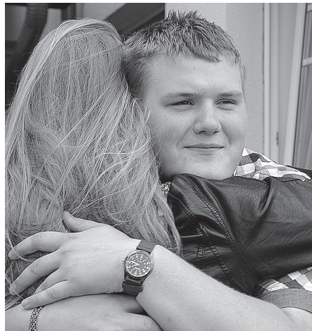
Ak, jaunība! Apskauj vienu, bet skatās uz otru.