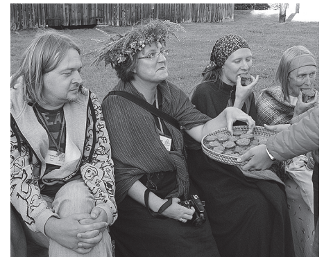
– Vai latgalietis, kad apēd sklandurausi, kļūst par suitenēm?