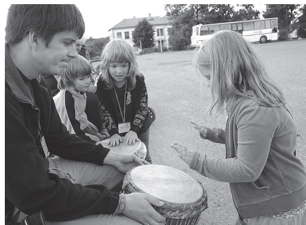
Šis varētu būt labs pusdienu signāls...