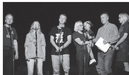
Krūmiņu dzimta (Rīga, Miami) – Gauži raud saulīte