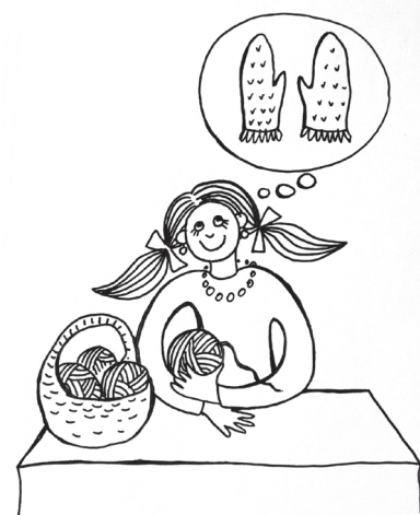
Dagnijas Pārupes zīmējumi.

Sanākot adatas pinuma ievirzē, visas sievas ļāvušās sākumā sapņiem, proti, visām nu tik tapšot cimdi, zeķes utt. Tad pamazām vien entuziasms placis. „Labi, vismaz būs cimdi. Nu labi, lai būtu vismaz bērnam! Nē, vislabāk tomēr zidainītim. Un noteikti bez ikšķa!” ▲