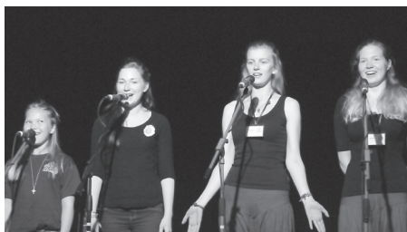
Kvartets Pārvārisi kanoē akapellā smailīte – Domāts, darīts