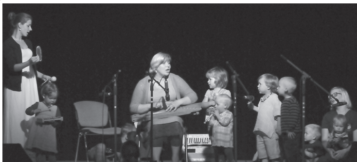
Pusreizpuse – Kopā, kopā, visi mūsu bērni

Ļoti atvainojamies, ka apjoma dēļ visi dziedātāji un muzikanti avīzē neiekļuva! Tik un tā – jūs visi esat lieliski!