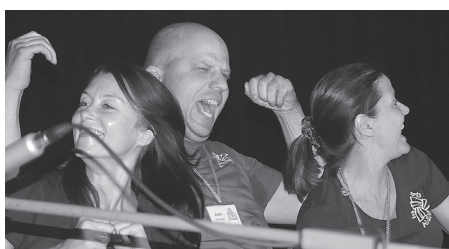
Grupa Seski – Tōļi dzeivuoļ muna meilō – cēstieni radīt jaunu – galda deju žanru