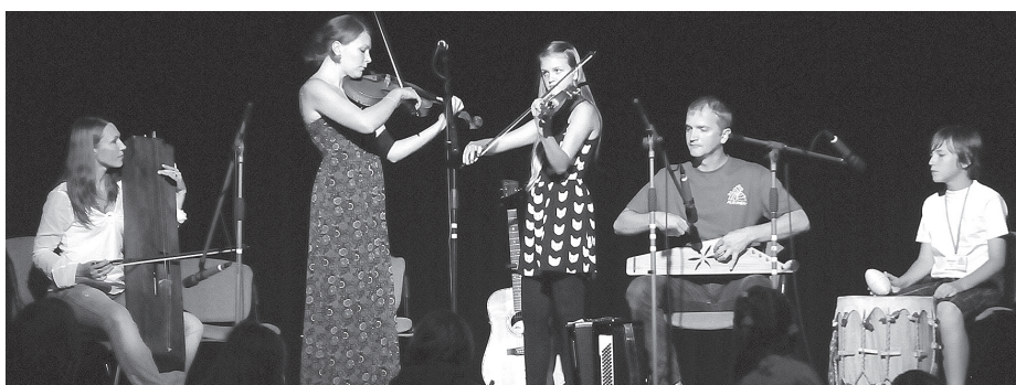
Grupa Trejdeviņi – Saules meitas sagšas raksta un vēl 5 dziesmas