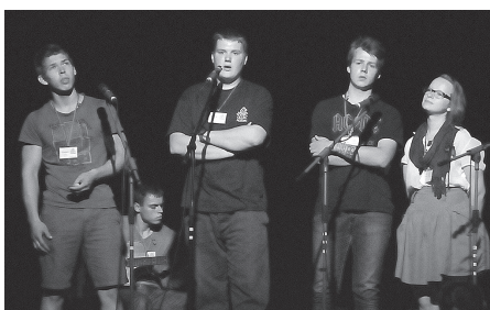
Apvienība Vientuļi viensūņi (no visām malu viensētām) – dziesmā mudina radīt jaunu kustību vientuļiem cilvēkiem 1x1