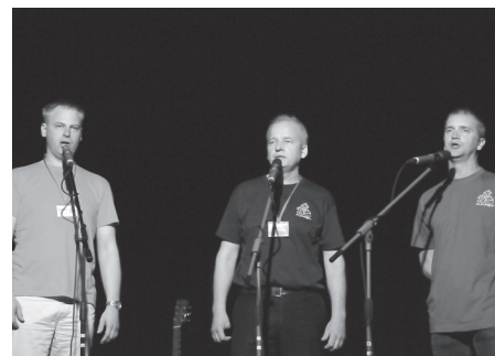
Vīru kopa Vilki (Rīga) – Kur, vilčiņi, čunčīnāji