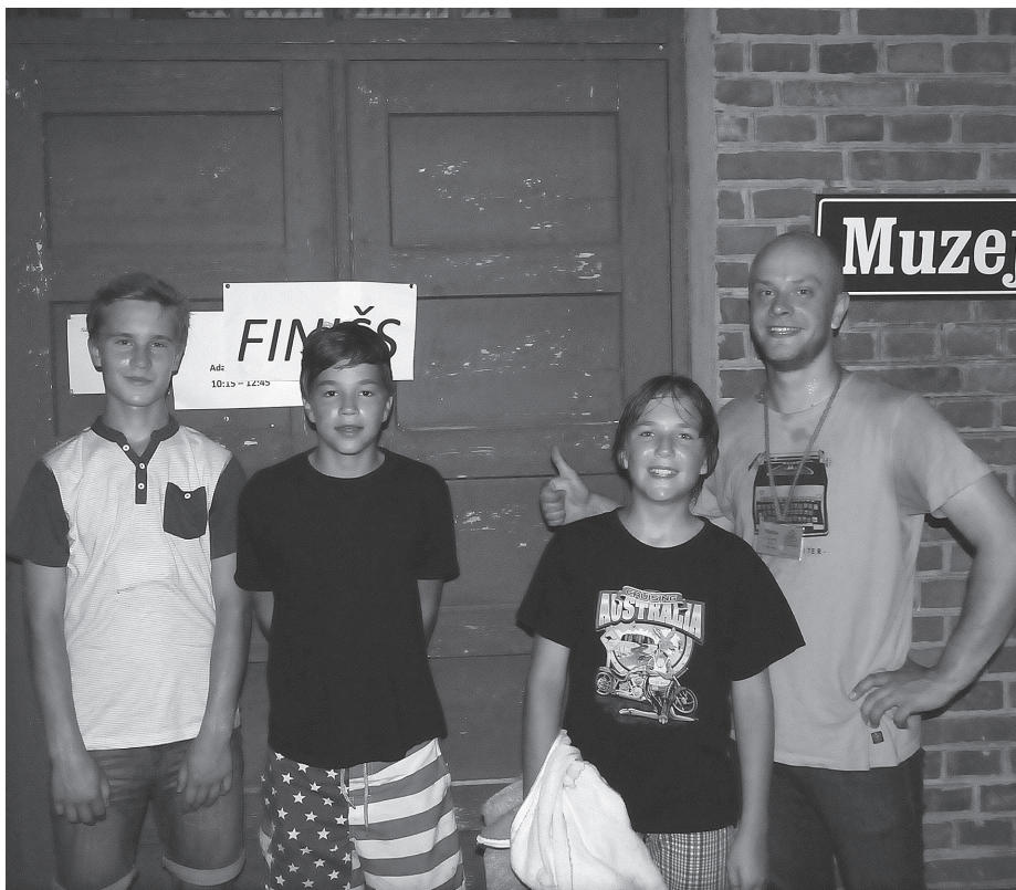
Īstus vīrus rotā ātrums un sviedri.

V akar vakarā notikušajās nakts orientēšanās sacensībās no metnes dalībnieki pārbaudīja savas zināšanas par Alsungu. Tika meklēti kontrolpunkti visdažādākajos Alsungas nostūros un atpazītas gan mīklas, gan vietējie simboli. Par garlaicību vai sliktu pasākuma organizēšanu sūdzēties nevarēja, jo sacensību dalībnieki tika iztecināti krustu šķērsu pa Alsungu. Lai laikā