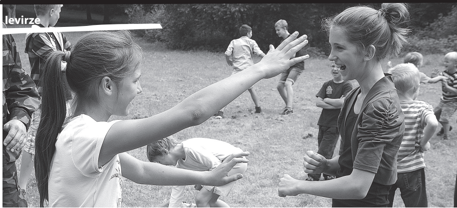
Mazās 3x3 –nieces zina, ka paš aizsardzības māka meitenēm ir ļoti svarīga.