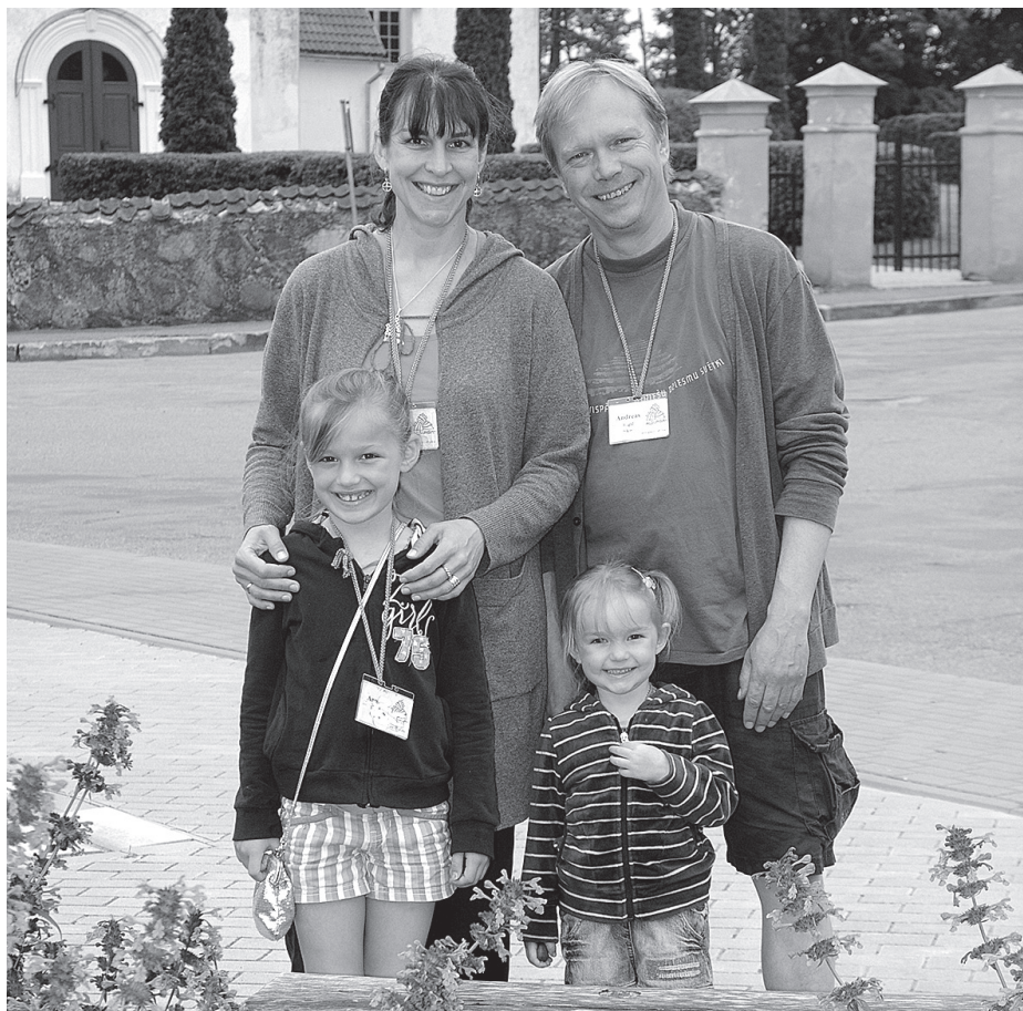
Rogal ģimene no Beļģijas.