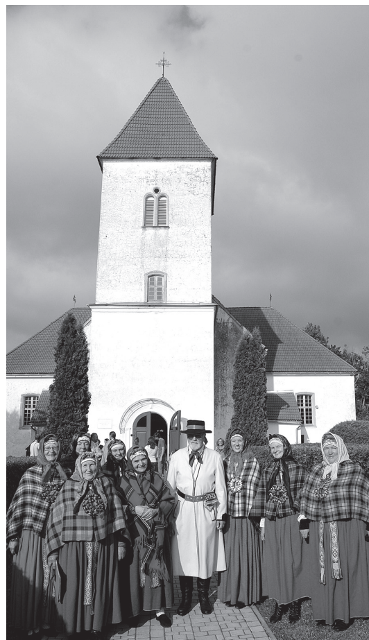
Suitu tēpi visā savā godībā – gan krāšņie sievu maģoņu brunči, gan garie baltie vīru svārki.