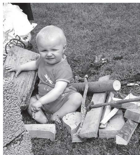
Dažus bērnus atnes stārķis, citus – atrod kāpostos. Vai te būtu jauna 3x3 ievirze – Bērnu iztēšana no koka pagales – līdzīgi kā Pinokio?

lebedik – labi, interesanti, tur gā lebedik