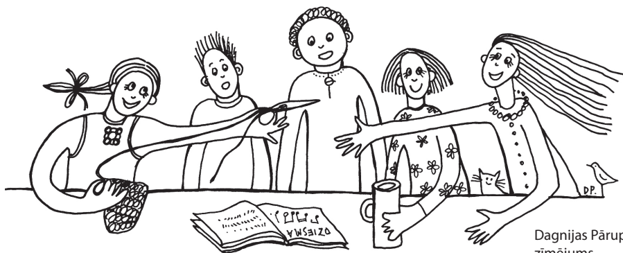
Dagnijas Pārupes zīmējums

Manot norūpējušos kolēģus, Ansis kautrīgi saka, ka mūsu redakcijas telpā esot izveidojis pats savu radiostudiju. Un ierunājies reklāmu savam raidījumam 21. gadsimta latvietis . Bet svarīgākais, ka par to viņš MUTES BRŪKA redakcijai šokolādi NEATNESĀ!!! ▲