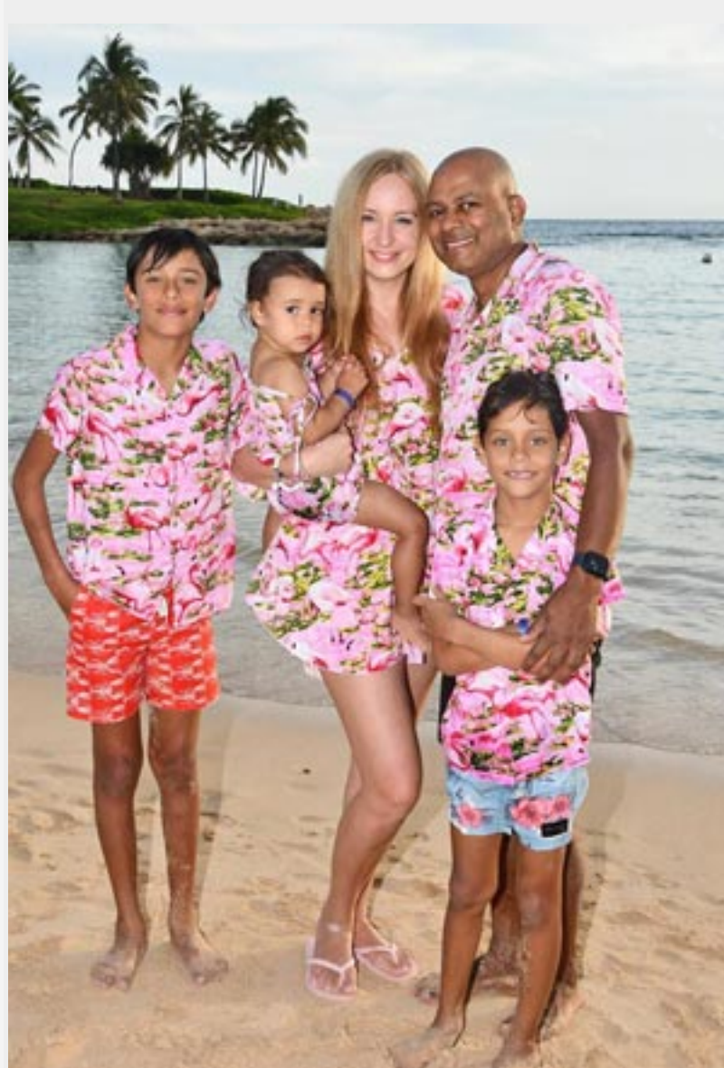
Segaru ģimene.