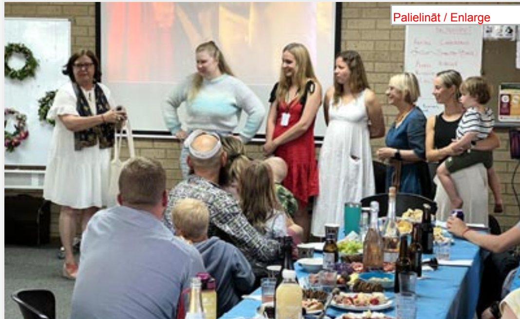
Guna Segara piedalās 3x3 nodarbībās.