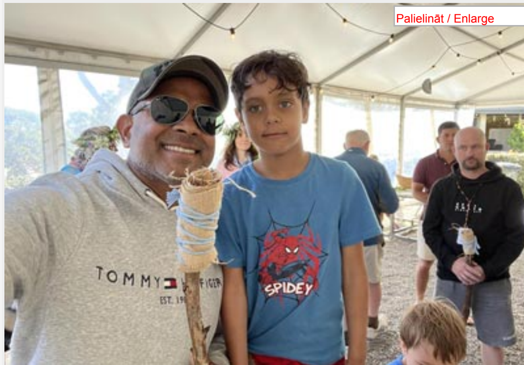
3x3 nodarbības.