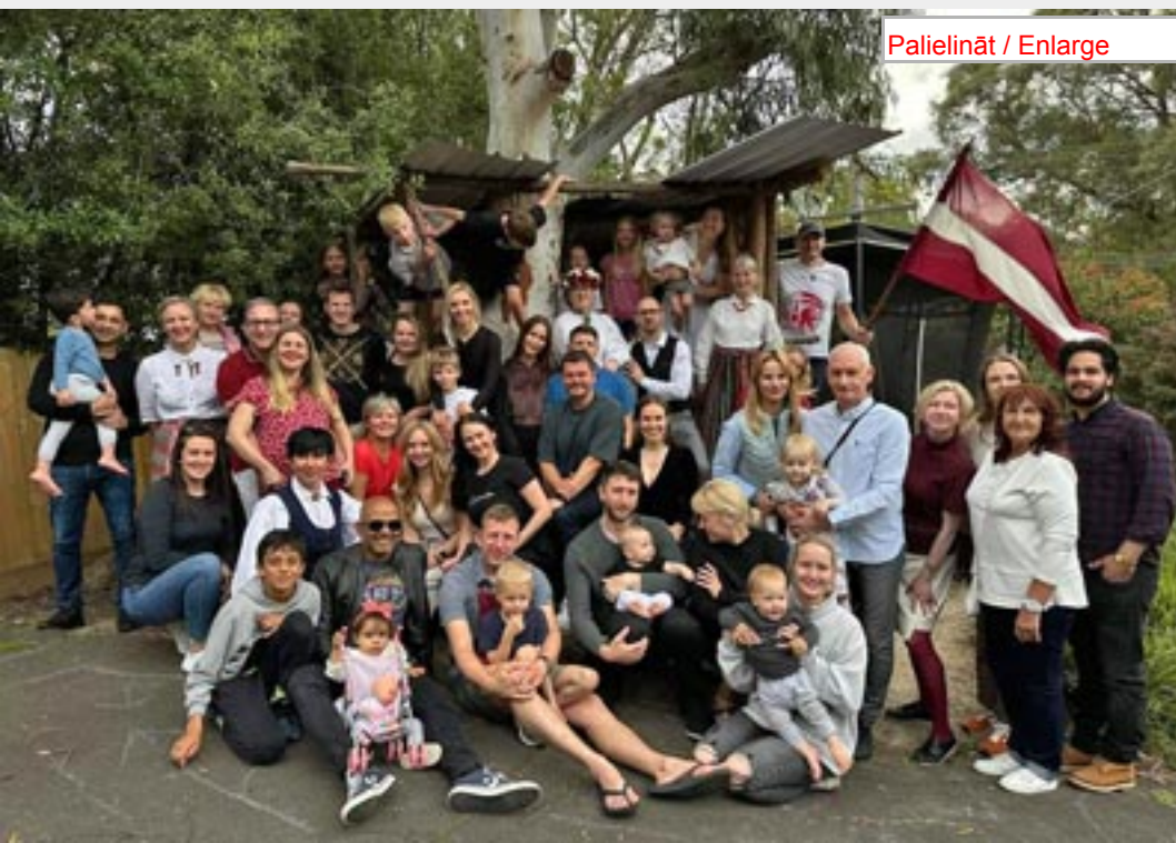
18. novembra svinēšana 2022. gadā.