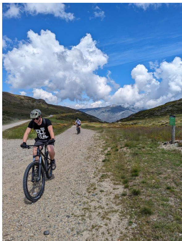
Foto: 3x3 saieta dalībnieks