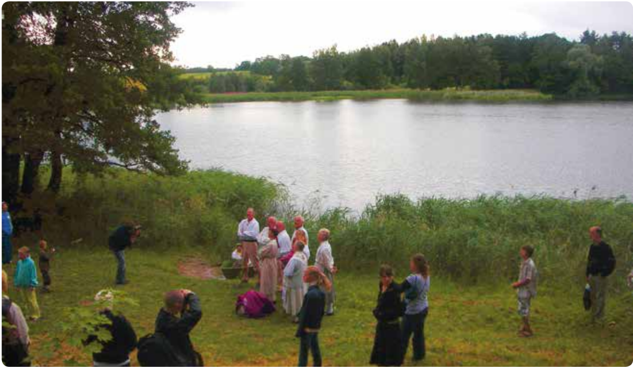
Dabas modināšana pie Āraišu ezerpils ar folkloras festivāla Baltica dalībniekiem