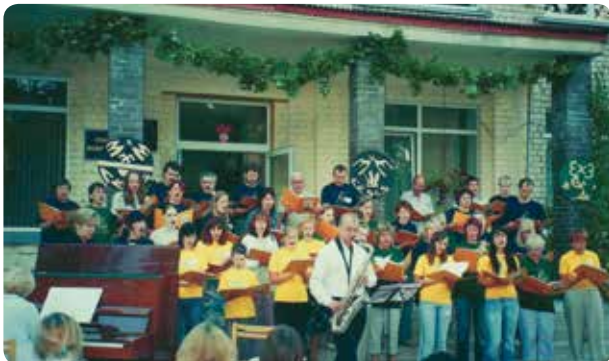
Nometnes koris koncertā pirms došanās uz Raimonda Paula dziedāšanas svētkiem Cēsīs