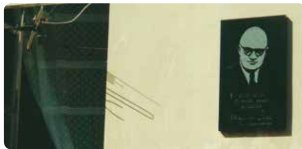
Latvijas brīvvalsts laikā Drabešu muižas kungu mājā atradās sešklasīgā pamatskola un 1925.–1928.gadā par skolotāju un skolas pārzini tajā strādāja dzejnieks Aleksandrs Čaks. Par to atgādina piemiņas plāksne.