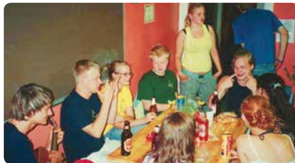
Pēc dančiem uz nīkšanu kafējnicā jaungskungi savas dāmas aiznesa pikpaunā. Dziedāšana ilga līdz rīta trijiem ...