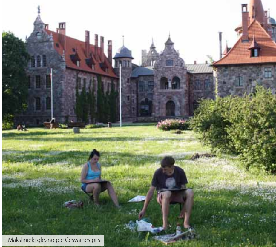
Mākslinieki glezno pie Cesvaines pils

K ā zināms 3x3 kustības, kas pulcē kopā latviešus no visas pasaules, gan no austrumiem, gan rietumiem un, protams, no Latvijas, pamats ir latviskā gara veidošana un stiprināšana.