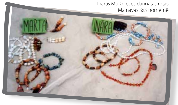
Ināras Muižnieces darinātās rotas Malnavas 3x3 nometnē