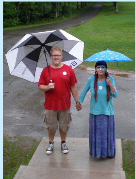
Lielākais un mazākais lietussargs noņemnē