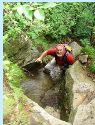
Kaaterskill High Peak