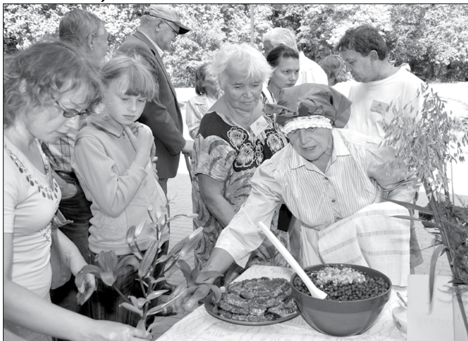
Cienā Kurzemes virtuves ievirze. Galdā bija skābputra, pelēkie zirņi ar speķi un Kurzeemes sklandrauši.