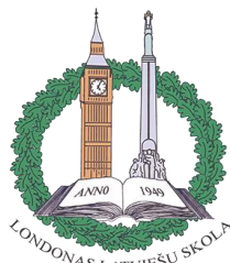
LONDONAS LATVIEŠU SKOLA