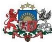
LATVIJAS REPUBLIKAS VĒSTNIECĪBA APVIENOTAJĀ KARALISTĒ