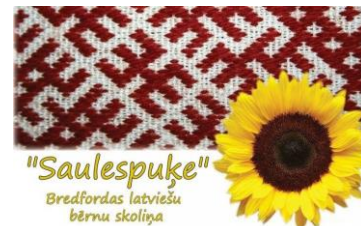
"Saulespuķe" Bredfordas latviešu bērnu skoliņa