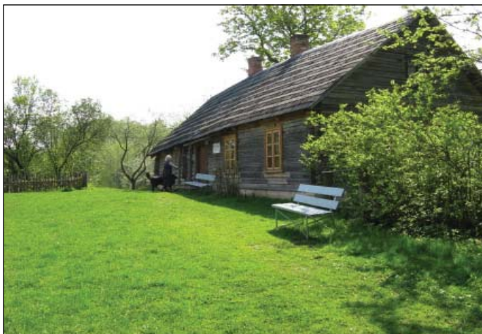
„Riekstiņi” - Jāņa Jaunsudrabiņa muzejs