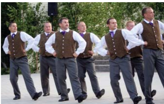
Dejo Neretas deju kolektīvs "Sēļi".

„SANĀCIET, SADZIEDIET, SASADANCOJIET...”