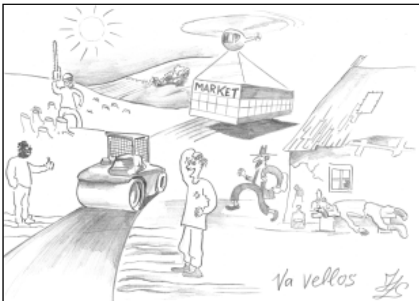
Ilgvara Zāra zīmējums

- Latvijā visaugstāk vērtēju cilvēkus, saprašanās ar tiem, tradīcijas.