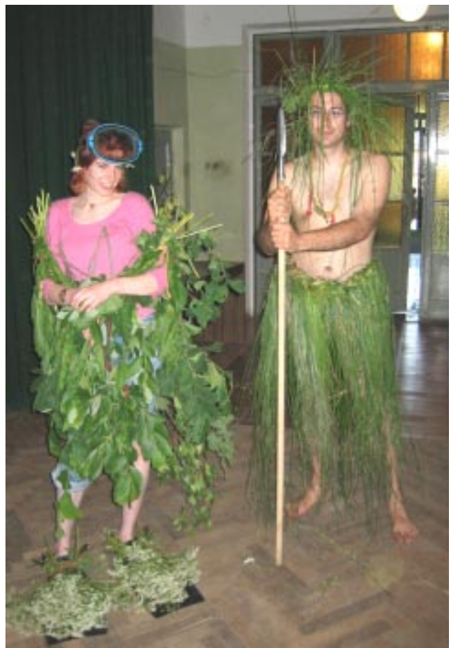
Gata Neimane foto

Viegls satraukums mudināja klātesošos apsēsties un, nevarot sagaidīt pasākuma sākumu, sākt aplaudēt. Ingus Krūmiņš, kas gādāja par visa kārtību zālē, ar sirsnīgu smaīdu viesā dziedinošu ticību, ka teju, teju viss sāksies. Dziesminieku izpildījumā visvairāk bija manāma vēlme teikt, ka es dziedu tikpat daudz sev, cik Tev, ka mani saviļņo mans darbs un tas,