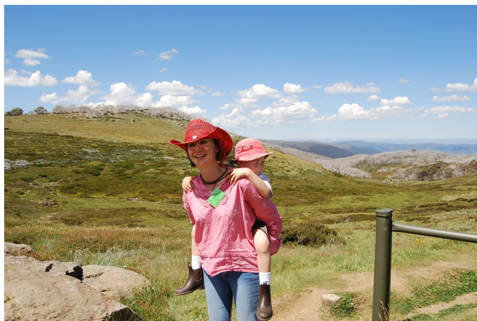
Daži tikuši pie nesēja

Drīz vien gan atklājās, ka solīto 4 km vietā staigāt vajadzēs vismaz uz pusi vairāk. Šajā brīdī strauji palielinājās līdzpaņemtā dzeramā vērtība. Šo faktu gan neviens ļaunprātīgi neizmantoja, bet draudzīgi dalījās gan ar ūdeni, gan citām aromātiskākām dzirām. Bez tam lieliski atsvaidzinošs izrādījās strauta ūdens, kas acīgam staigātājam bija pieejams vismaz pāris reizes.