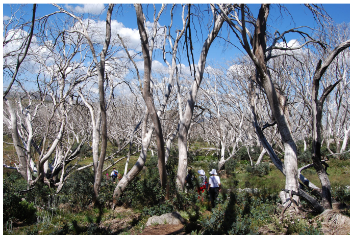
Mūsējie starp izdegušajiem eikaliptiem

kā šie koki izskatījās zaļi, un apgalvoja, ka šodien te izskatās ne mazāk interesanti!